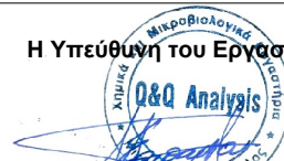
ΕΒΙΝΑ ΠΑΠΑΡΙΖΟΥ Βιολόγος, Msc